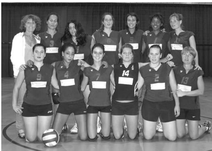
Équipe pré-nationale féminine