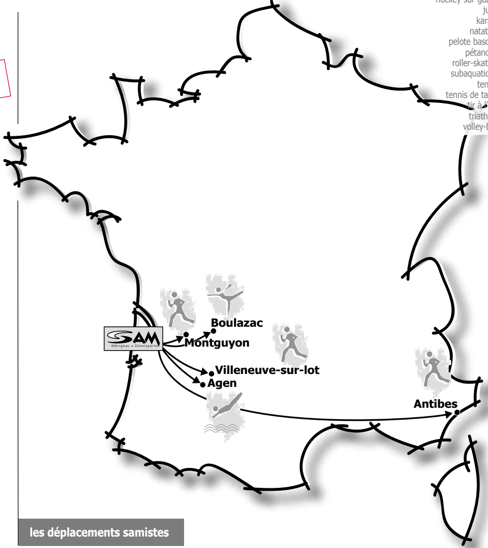
les déplacements samistes

Près de 300 numéros de cet hebdomadaire ont été réalisés depuis sa naissance le 5 avril 2005. JJB a toujours répondu présent pour la quêtes et la rédaction du contenu. Nous tenons, très sincèrement à le remercier pour son engagement, sa connaissance des réseaux et sa précieuse collaboration.